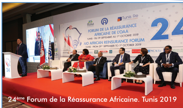
24 ème Forum de la Réassurance Africaine. Tunis 2019